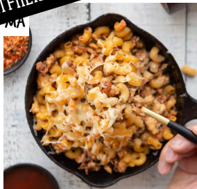
MUTKAT SVORIKSI -MAKARONILAATIKKO