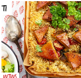
VUNIRIISIN VOITTAMATON PALUU