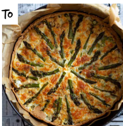
VAPUN MAUKKAIN PARSAPIIRAS